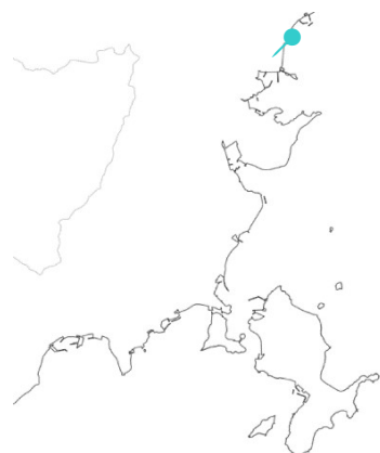
国土地理院白地図